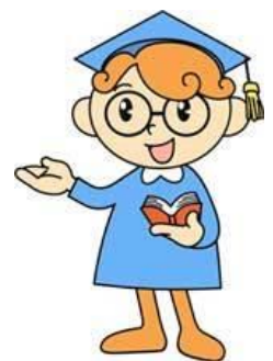
ヒューマン博士 (福岡県の人権啓発 キャラクター)